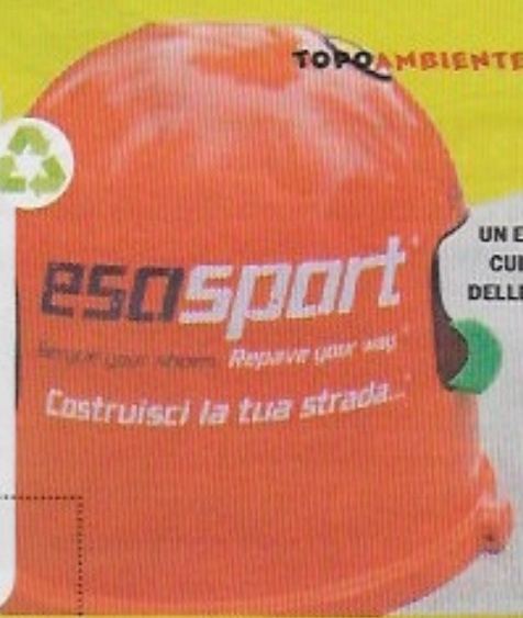
UN ESOSBOX IN CUI DISFARSI DELLE VECCHIE SCARPE