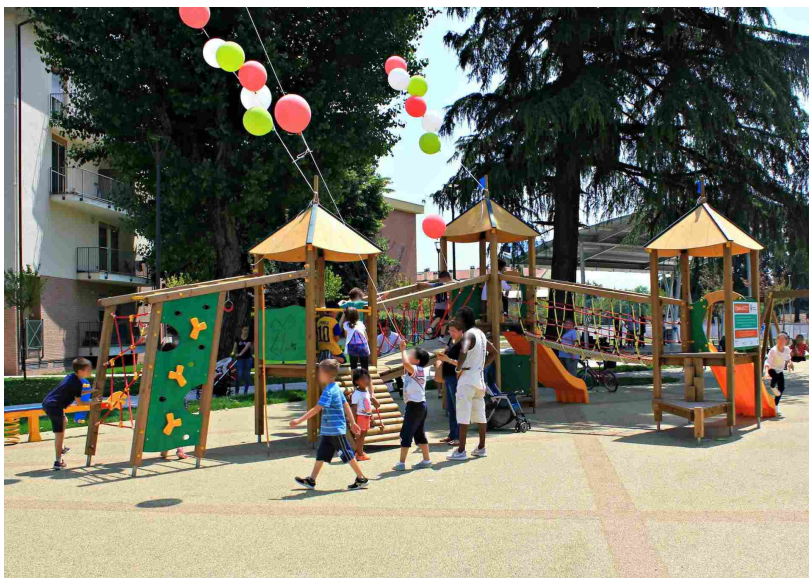
Il parco giochi di Cesano Boscone, inaugurato lo scorso giugno, è stato realizzato con pavimentazione in materiale granulare ottenuto dal riciclo di scarpe sportive consumate