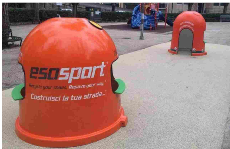
Esosport sbarca nelle Marche