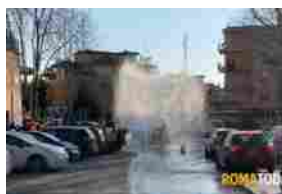
Geysir a Monteverde, la tubatura si rompe e l'acqua invade la Gianicolense