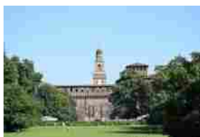
Milano: cultura, spazi urbani e sviluppo sociale. Webinar mercoledì 10 marzo