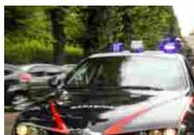
Roma est, otto comitati scrivono al Governo: "Riaprite la caserma di via Rubellia"