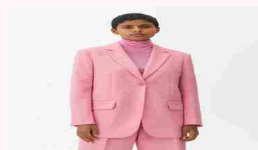
Dove comprare bei blazer, completi e tailleur