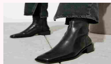
Stivaletti belli per l'inverno 2021