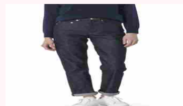
Jeans a palazzo e a gamba dritta per pere