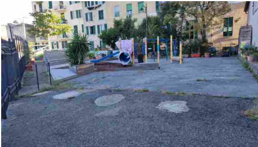
Dalle scarpe da ginnastica il rivestimento antitrauma