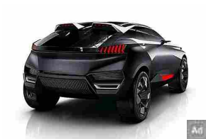
Auto ibride invendute del 2020 - i prezzi potrebbero sorprenderti