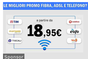
Super offerta FIBRA a partire da 18,95€ al mese... promo.comparasemplice.it