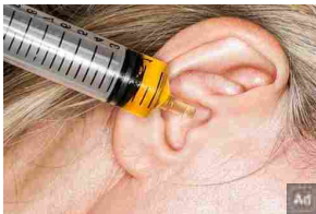
Vuoi sentire bene e senza distorsioni? Usa questo per 10 giorni