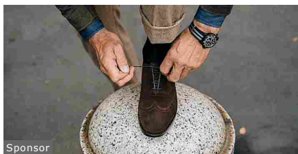
Scarpe artigianali, fatte con cura. Velasca