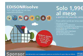
Goditi il tuo tempo libero, alla tua casa ci pensa... edisonrisolve.it