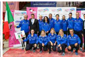
Mondiale di bocce di Alassio verso il gran finale - Liguria Notizie