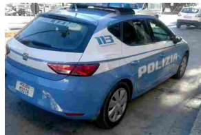
Rumeni trovati con 32 scatolette di tonno rubate: denunciati - Liguria ...