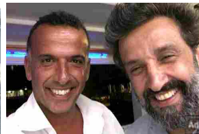
Flavio Insinna è ancora fidanzato? La verità sulla sua relazione