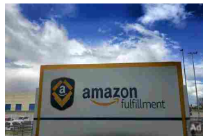
Lavora con Amazon da casa e guadagna 1.500 € al mese. Scopri come